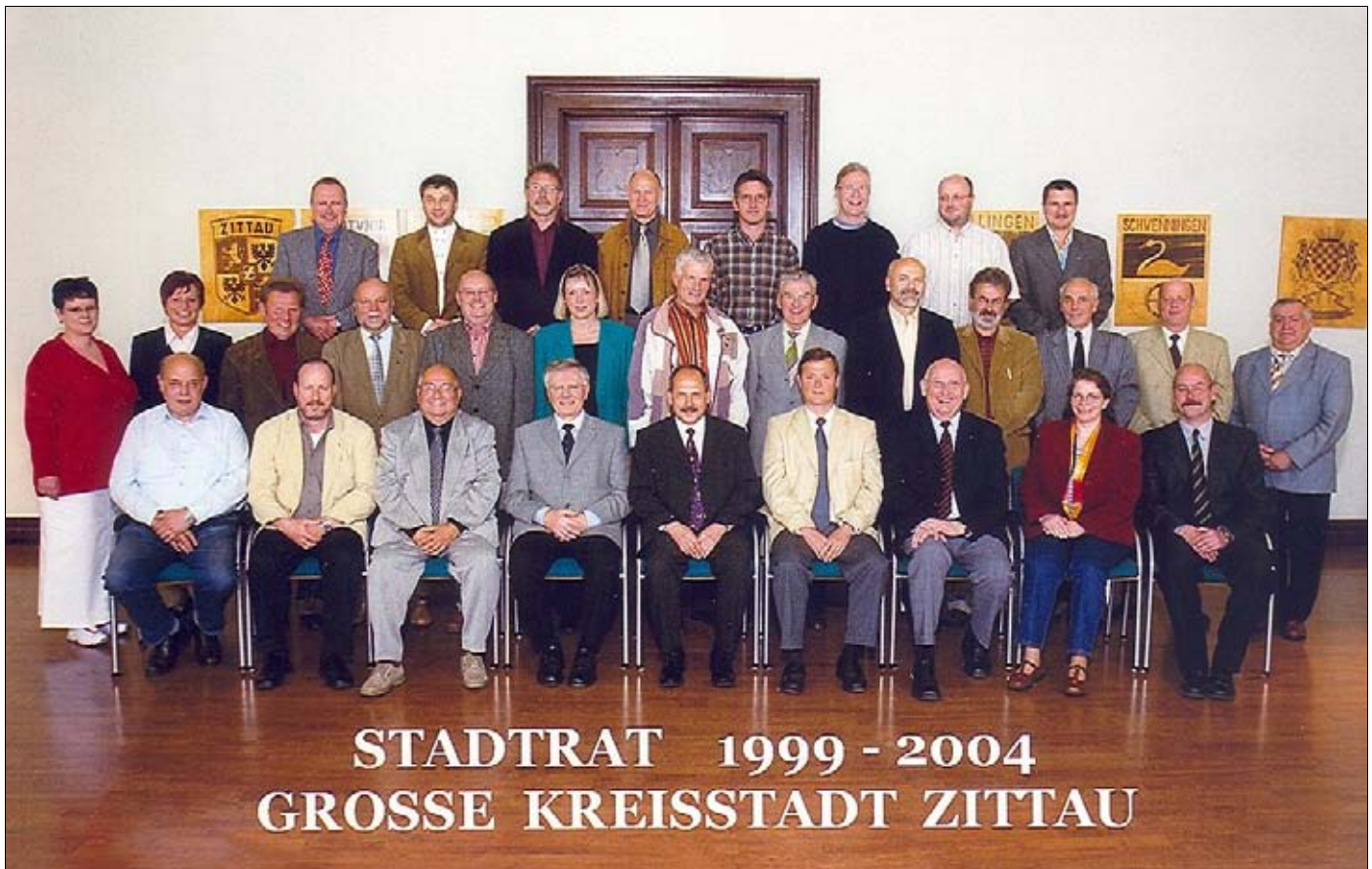
STADTRAT 1999 - 2004 GROSSE KREISSTADT ZITTAU