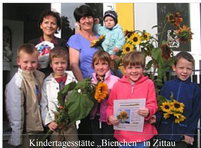
Kindertagesstätte „Bienchen“ in Zittau